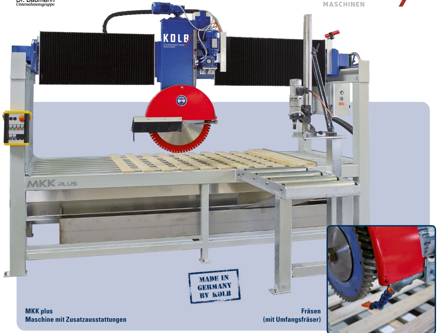
MKK plus Maschine mit Zusatzausstattungen