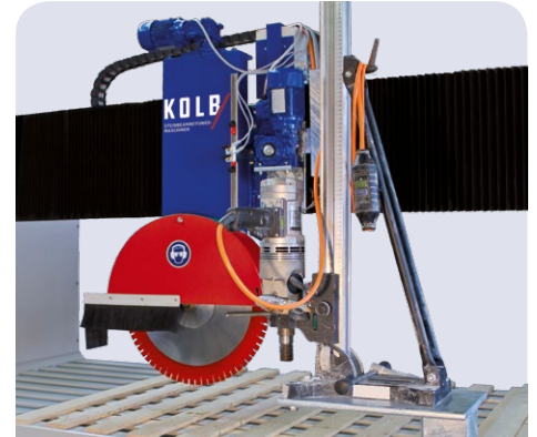
Seitlich angebaute Bohrmaschine (optional)